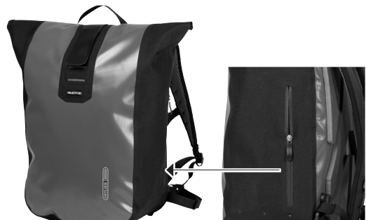
Reißverschluss-Außentasche (nicht wasserdicht)